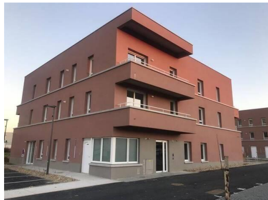
Le nouvel accueil de jour « Le temps de vivre » de l'association Le temps du regard se situe au rez-de-chaussée du bâtiment A de la résidence Tempo, à Acigné.

Le nouvel accueil de jour se situe au rez-de-chaussée d'un bâtiment de deux étages construit par l'entreprise Aiguillon construction, d'avril 2021 à janvier 2023, dans le cadre du projet de résidence Tempo (voir plus bas). Il sera loué à l'association Le temps du regard, au-dessous de 6 logements locatifs sociaux.