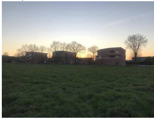
Le foyer de vie « Le Botrel » se situera en face des trois bâtiments construits lors de la première tranche de la résidence Tempo, à Acigné.

Dans le foyer « Le Botrel », 16 logements seront loués à des personnes en situation de handicap : 12 studios regroupés au rez-de-chaussée, reliés à des parties communes, et 4 studios individuels dans les étages, dédiés à des personnes en capacité de vivre de façon indépendante. Des logements locatifs seront occupés par des particuliers, au-dessus.