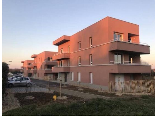
L'accueil de jour se situe dans l'un des trois bâtiments de deux étages de la résidence Tempo, au milieu desquels se trouve la maison de voisinage, à Acigné, au Botrel.

L'association Le temps du regard, qui accompagne une centaine d'adultes en situation de handicap près de Rennes, a reçu les clefs de sa nouvelle maison de voisinage et de son nouvel accueil de jour à Acigné, lundi 6 février 2023. Ils devraient ouvrir en mars, au milieu d'autres logements, avant un foyer de vie d'ici 2025.