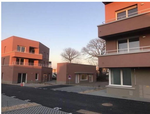
La nouvelle maison de voisinage se situe entre les bâtiments A et B de la résidence Tempo, à Acigné, au Botrel.

À côté du bâtiment où se trouve l'accueil de jour, une maison de voisinage de 64 m 2 est presque opérationnelle. Il manque une cuisine, qui devrait être livrée d'ici fin février. Son ouverture est également prévue en mars.