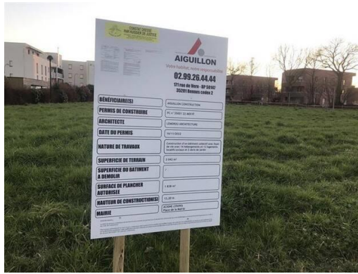
Le permis de construire du bâtiment collectif avec foyer de vie date du 16 novembre 2022.

Dans le foyer « Le Botrel », 16 logements seront loués à des personnes en situation de handicap : 12 studios regroupés au rez-de-chaussée, reliés à des parties communes, et 4 studios individuels dans les étages, dédiés à des personnes en capacité de vivre de façon indépendante. Des logements locatifs seront occupés par des particuliers, au-dessus.