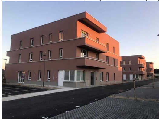
La première tranche de la résidence Tempo comprend quatre bâtiments, à Acigné.